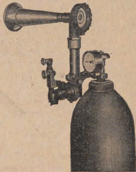
Syrena na zgęszczone powietrze lub gaz.