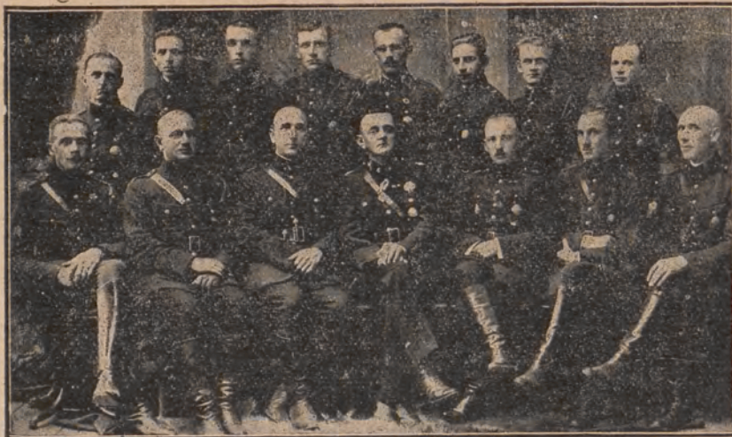
Członkowie korpusu inspekcyjnego Związku Lubelskiego z prezesem tego Związku w dniu odprawy.

Uznano również za konieczne organizowanie gminnych komisji przeciwpożarowych, któreby prze-