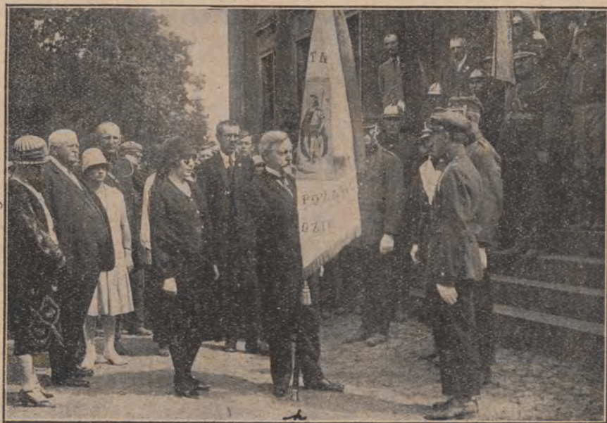
Uroczystość poświęcenia nowego sztandaru Ochotniczej Straży Pożarnej w Łądzie. Zdjęcie przedstawia chwilę wręczania Straży nowego sztandaru.

Wyekwipowanie Straży przedstawia się następująco. Straż posiada remizę murowaną ze sceną, sikawkę przenośną z 5 mtr. węża ssawnego i 15 mtr. węża tłocznego (b. mało!), 3 drabinki przystaw-