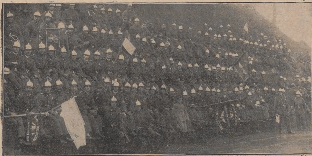
Tłumnie zgromadzona na zjeździe kolejowa bractwa strażacka z zainteresowaniem śledziła przebieg zawodów konkursowych, oczekując ich ostatecznego wyniku.

VI-ta ćwiczyła Straż M. F. Łapy pod kom. nacz. Martinsa. Bardzo efektownie wypadła tu musztra, wykonana przy dźwiękach własnej doskonałej orkiestry; poziom wyszkolenia naogół bardzo dobry, ale znać jeszcze dużo nie-