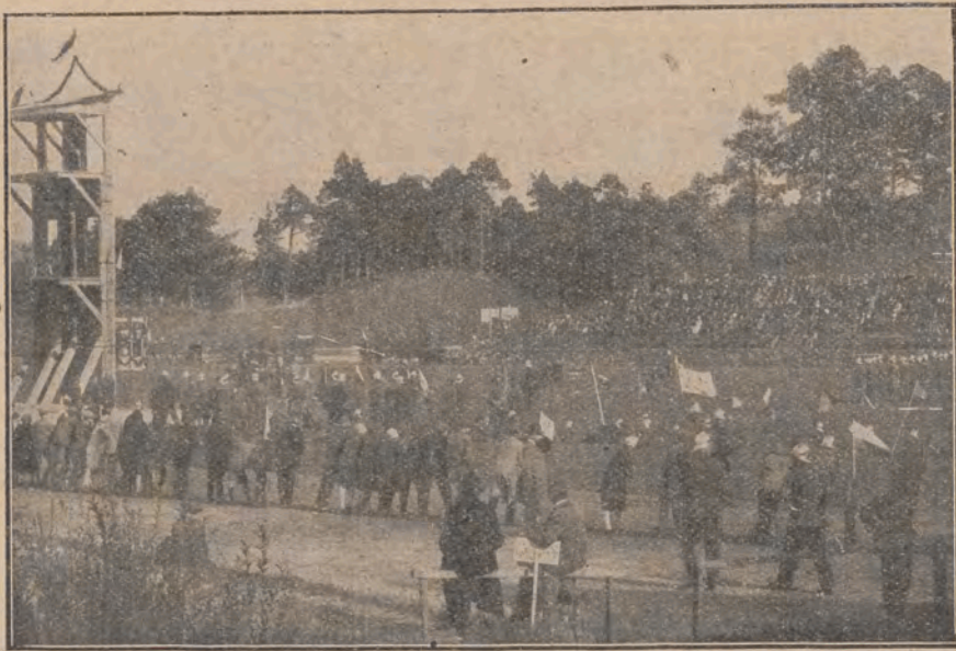
Zawody konkursowe kolejowych stazy pożarnych Dyr. Wileńskiej odbywały się na pięknym i malowniczo położonym boisku 6. P. Piech. Legj. w Wilnie.