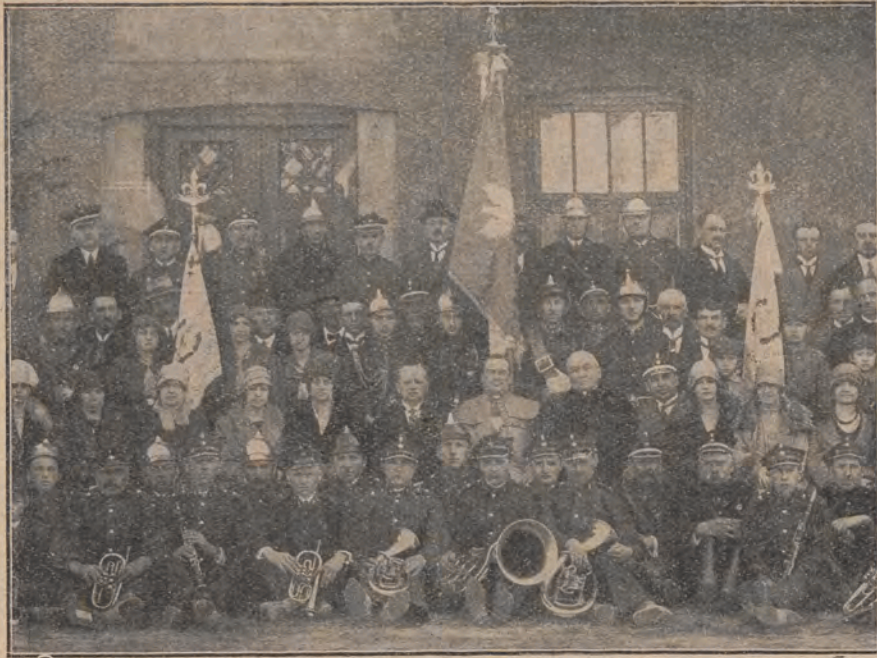
Ochotnicza Straż Pożarna przy fabryce „Strem” w Strzemieszycach obchodziła uroczystość poświęcenia nowego sztandaru. Zdjęcie powyższe przedstawia członków Zarządu Straży, Dyrekcję Fabryki oraz zaproszonych na tę podniosłą uroczystość gości. W środku widzimy nowozakupiony sztandar Straży. Po obu jego bokach sztandary drużyn harcerek.