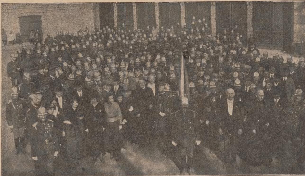
Uczestnicy uroczystości obchodu jubileuszowego Straży Częstochowskiej.