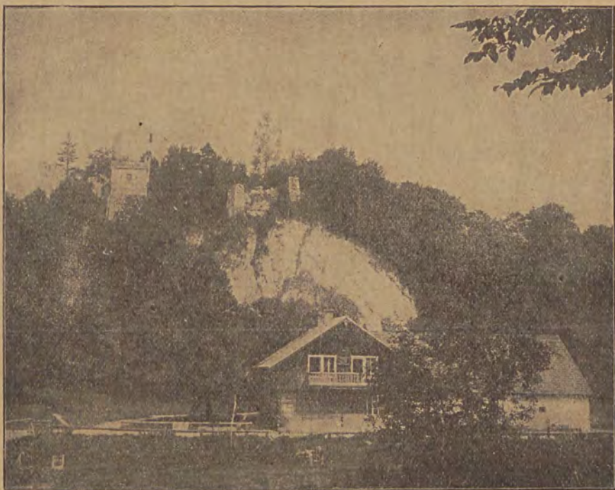
Der Burgberg in Ojców