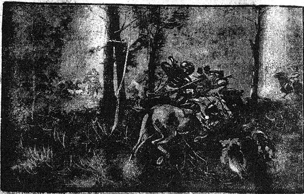
Według obrazu Józefa Brandta.