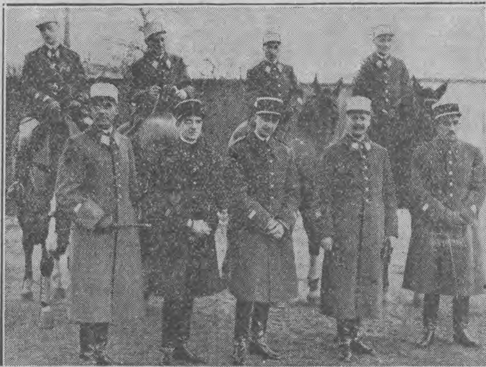
po raz pierwszy od czasu wojny wzięli udział w zawodach hipicznych w Niemczech.