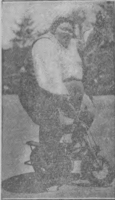
Najcięższa waga kobieca — zwyciężczyni w oryginalnym konkursie kołowym.