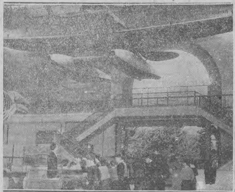
Uczniowie amerykańscy oglądają aparat, na którym bohater narodowy przeleciał Atlantyk.