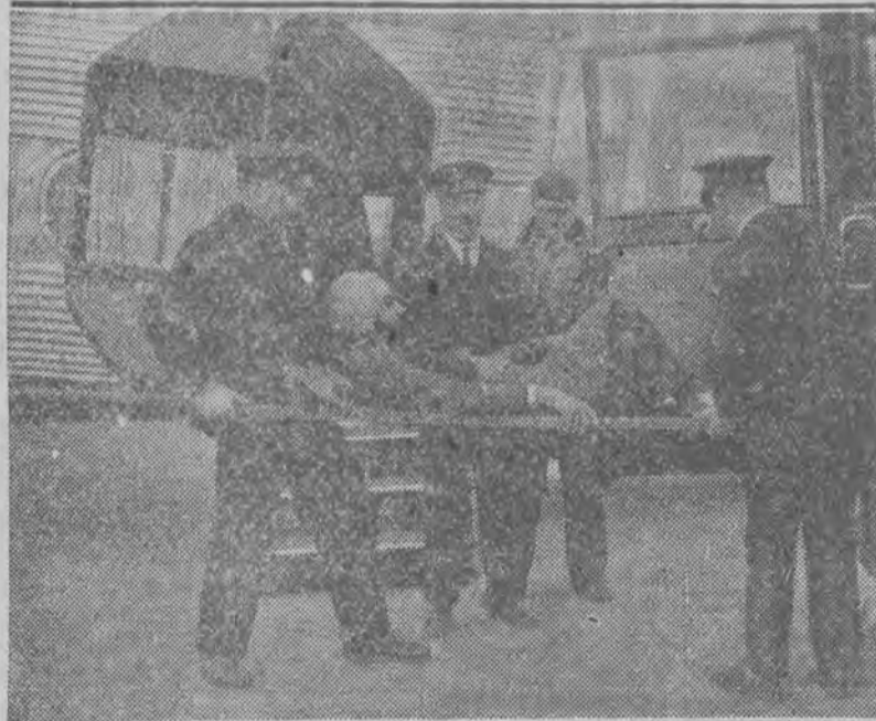
Szef pilotów maharadży Patialy spadł ze swym aparatem pod Montargis we Francji. Aparat został całkowicie zniszczony, a pilot uległ złamaniu nogi. Widzimy go podczas transportu do szpitala.