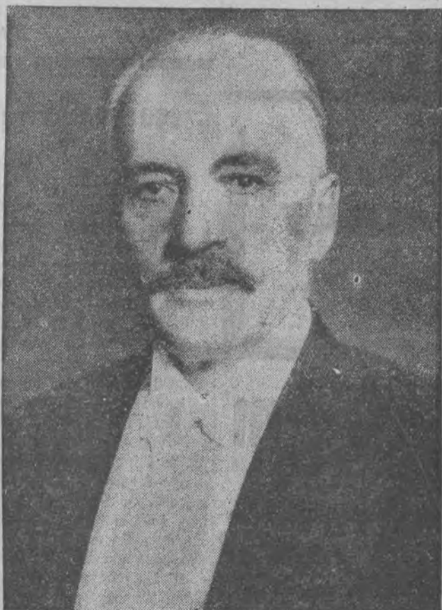
prezydenta Rzplitej prof. Ignacego Mościckiego

W dniu wczorajszym, jako w przeddzień imienin p. prezydenta Rzplitej, młodzież szkolna z Warszawy złożyła hołd p. prezydentowi.