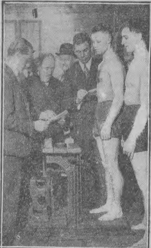
zawodnicy ze wszystkich krajów Europy walczyć w Londynie.