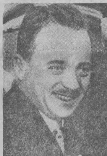
Dollfuss kanclerz Austrii.

Rozwiązanie partji socjaldemokratycznej i aresztowanie przywódców