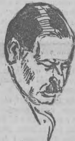
Otton Bauer przywódca socjaldemokracji.

Robotnicy elektrycy i gazownicy miejskiej przyłączyli się do strejku, wstrzymując do-