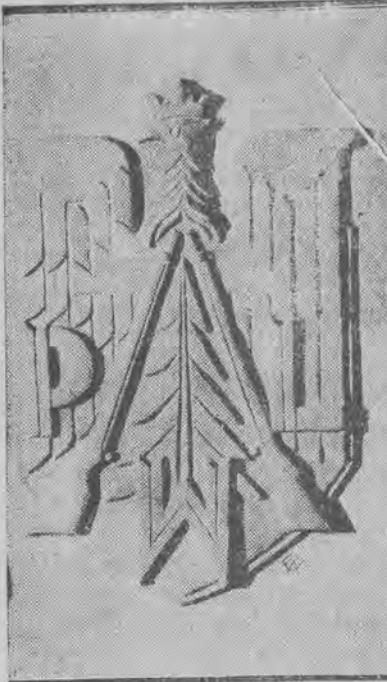
Odnaka P. W. leśników, wykonana według projektu p. Jastrzębowskiego.