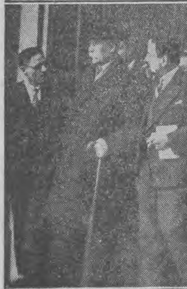
Marszałek Francji Pétain w cywilnym ubraniu przed pałacem Elizejskim.