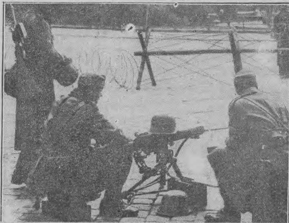
Heimwehra z karabinem maszynowym gotowym do strzału w centrum stolicy.