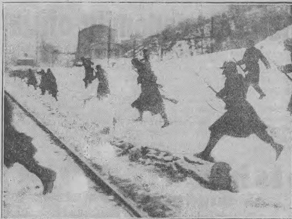
Atak wojsk rządowych na siedzibę socjaldemokratów na przedmieściu stolicy naddunajskiej