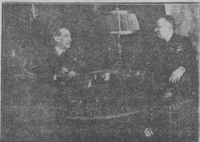
Minister Beck podczas rozmowy z komisarzem Litwinowem w komisariacie ludowym spraw zagranicznych w Moskwie.