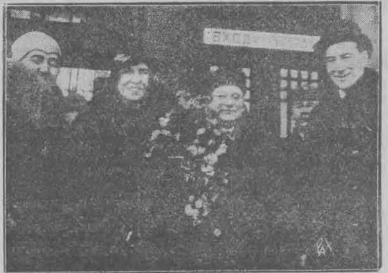
Minister Beck z małżonką na dworcu w Moskwie w towarzystwie przybyłego na ich powitanie komisarza spraw zagranicznych Litwinowa i jego małżonki.