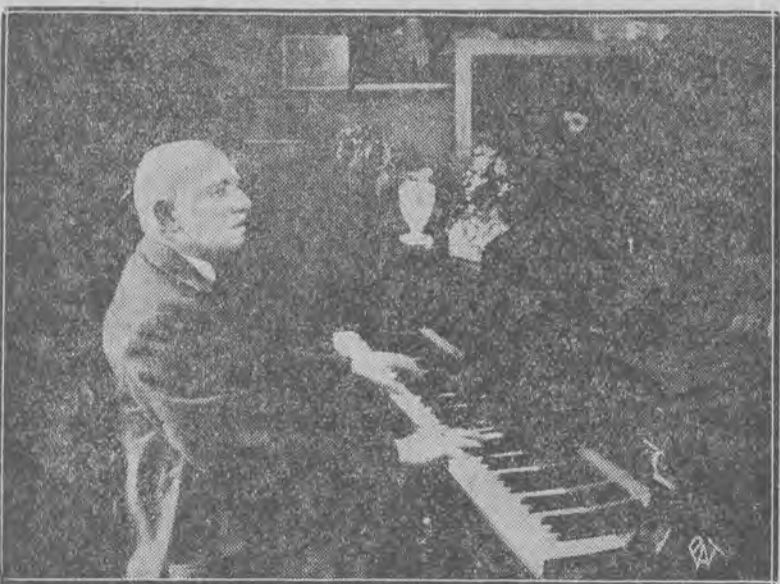
Znakomity pianista i pedagog, prof. Aleksander Michałowski

WARSZAWA, 20. 3. (PAT). — Dziś wieczorem w teatrze Wielkim odbył się pod wysokim protektorem p. marszałka Piłsudskiego oraz pod honorowym przewodnictwem premiera Janusza Jędrzejewicza uroczysty jubileusz 65-letniej działalności artystycznej Aleksandra Michałowskiego.