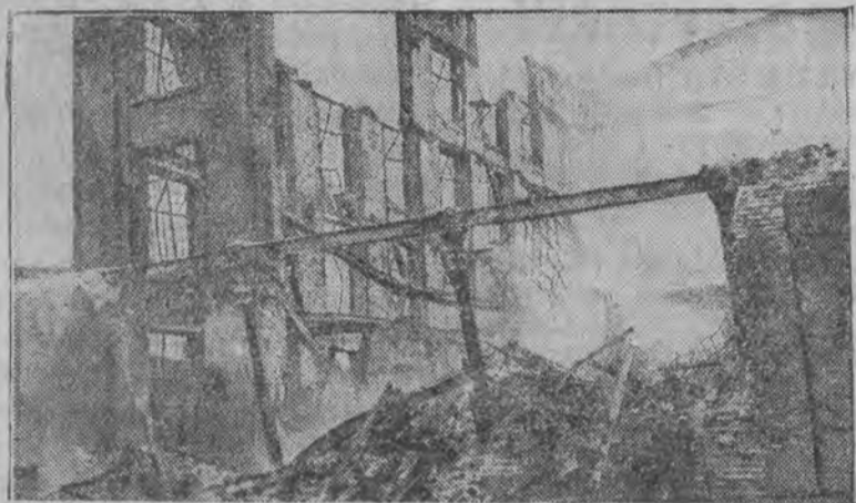
Spalona fabryka M. A. Winer. Zdjęcie dokonane w chwili walenia się konstrukcji żelaznych.

W ogniu zginęły trzy osoby, w szpitalu w ciężkim stanie przebywa 13 robotników