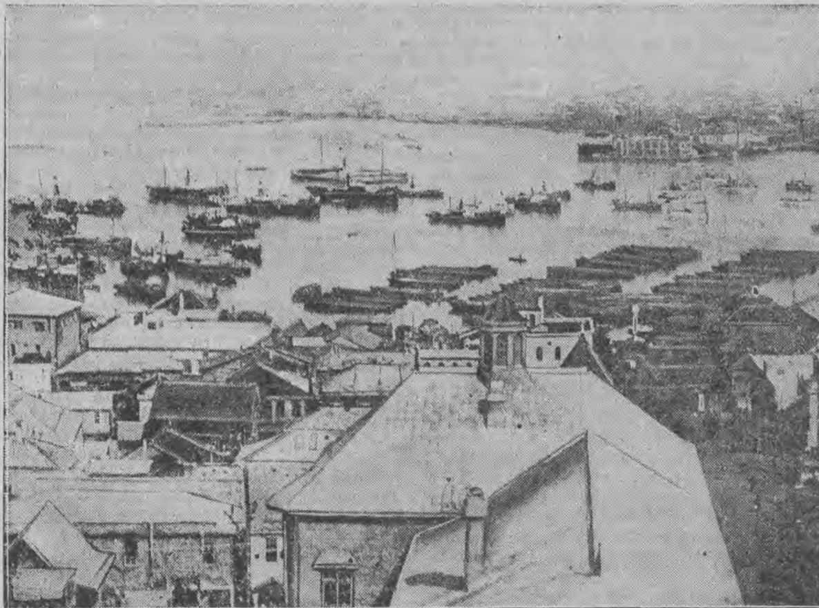
Ogólny widok miasta portowego Hakodate w Japonii, zniszczonego przez pożar i gwałtowny orkan. Jak donoszą ostatnie depesze liczba zabitych wynosi 1556 osób.