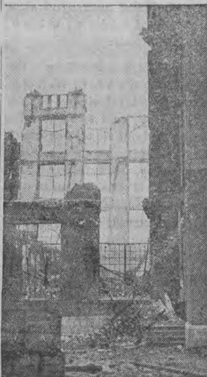
Sterczące mury na chwilę przed zawaleniem.