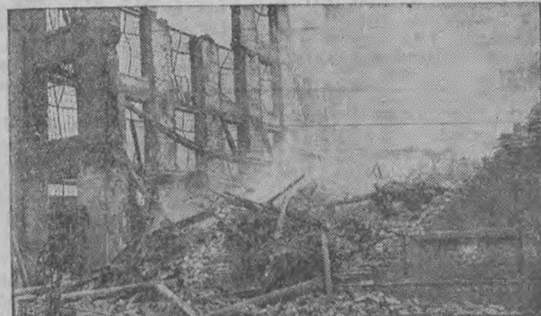
Dogasające zgliszcza wielkiego gmachu fabrycznego, w których znajdują się szczątki trzech ofiar.

Tymczasem przybyły silne oddziały policji. Wyloty ulic, prowadzących do miejsca katastrofy zostały obsadzone przez posterunki. Spędzając się o ofiar w ludziach, wezwano karetki pogotowia. Wkrótce na podwórzu znalazły się WSZYSTKIE WOZY, JAKI MI DYSPONUJĄ POGOTOWIA miejskie, ubezpieczalni społecznej i pogotowia noenego. Przybył także wóz Czerwonego Krzyża, wzywany tylko w bardzo wyjątkowych okolicznościach. LEKARZE ZORGANIZOWALI NA POCZEKANIU RODZAJ DORAŻNEGO AMBULANSU, a wysłana karetka przywiozła na miejsce pożaru wszelkie środki ratunkowe, dla udzielenia pierwszej pomocy poparzonym. Dopiero stamtąd przewożono rannych do szpitala im. prez. Mościckiego.