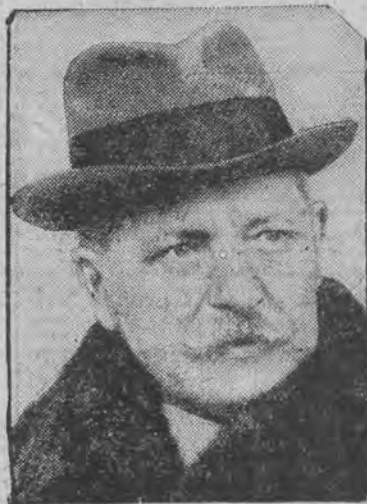
premjer bułgarski, obalony przez zamach stanu.

SOFJA, 22. V. (PAT). Z rozporządzenia nowego premjera Georgiewa pobory ministrów zostały zredukowane o 50 proc. Pozatem premjer wydał zarządzenie, ażeby licza samochodów, będących w rozporządzeniu ministrów i innych wyższych funkcjonariuszów państwowych, została znacznie zredukowana. Oprócz tego rozporządzenie ka suje „saloniki”, tak że ministrowie podróżować będą w ogólnych wagonach, jedynie w zarezerwowanych przedziałach. Również w celach oszczędnościowych skasowane zostały wszystkie dodatki do pensji.