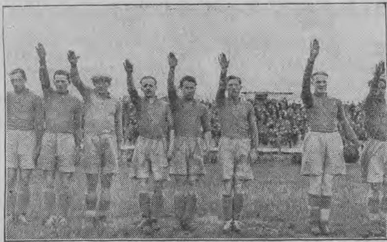
Hitlerowskie pozdrowienie drużyny niemieckiej „Minerwa“, która w poniedziałek poniosła zasłużoną klęskę od Ł. K. S. w stosunku 2:0.