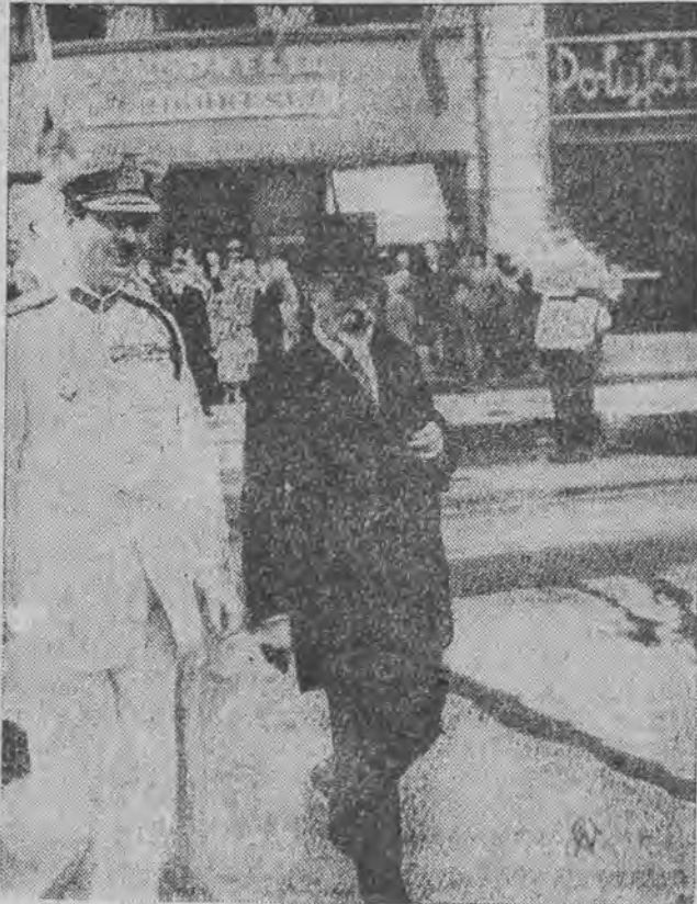
Monarcha rumuński w towarzystwie przybyłego do Bukaresztu francuskiego ministra spraw zagranicznych udaje się na zwiedzanie miasta, dając tm. króla Karola.