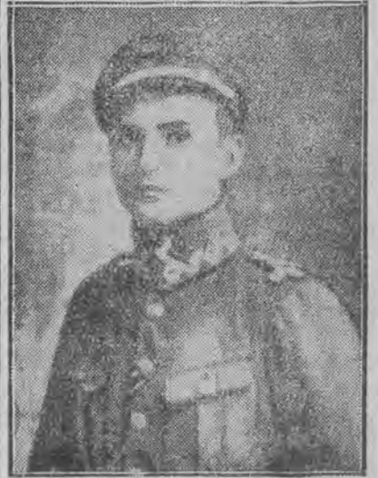
Plk. Leopold Lis-Kula zginął w walkach w r. 1918 na kresach południowo-wschodnich