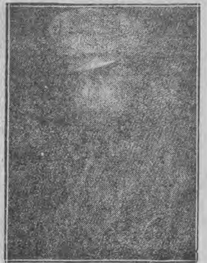
Kpt. Kazimierz Piątek-Herwin zginął pod Konarami 20 maja 1915 roku.