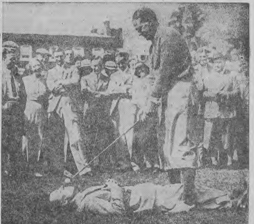
amerykański mistrz golfa, demonstruje publiczności szereg uderzeń.