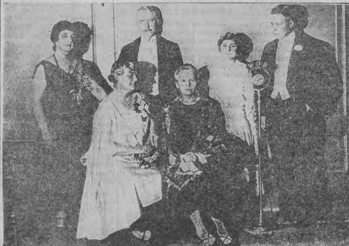
Marja Curie - Skłodowska podczas przyjęcia przez członków stowarzyszenia amerykańskiego do walki z rakiem.

Tę wolę zmarłej uszanowano dzięki w całej rozciągłości. Ale hołd wielkiemu umysłowi i najszlachetniejszemu sercu złożyli najwybitniejsi przedstawiciele Polski, przybranej ojczyzny Francji oraz całego świata, który umiał ocenić doniosłość dokonanej przez zmarłą