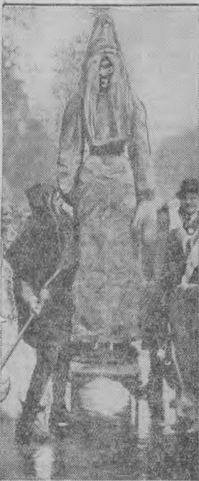
zniszczono podczas ludowej zabawy w Paryżu.