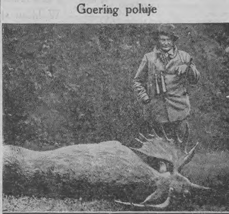
Jak wiadomo minister — premier — general otrzymał nowy tytuł — łowczego Rzeszy. Na zdjęciu widzi my go obok ubitej grubej zwierzyny