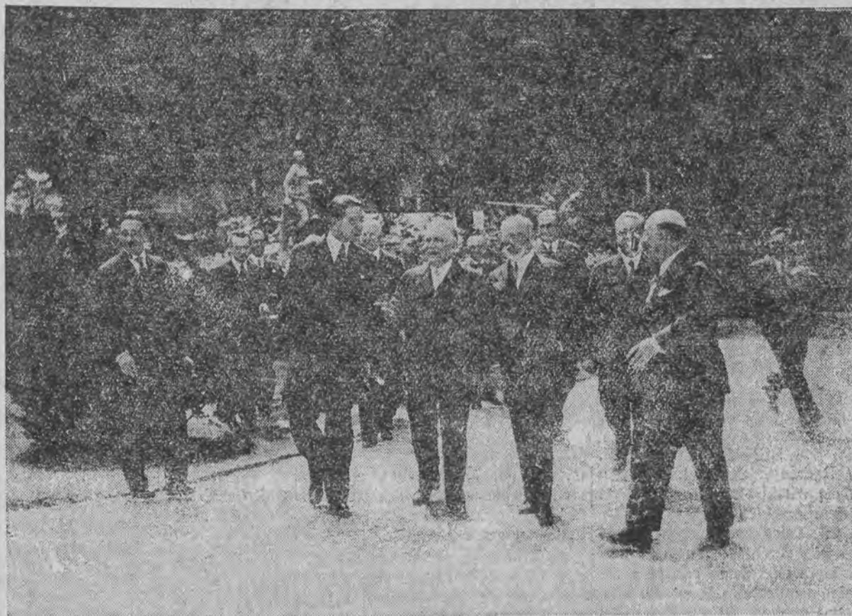
przyjęty był m. in. przez prezydenta Alberta Lebruna, który mu wręczył insygnia wielkiego krzyża legji honorowej.