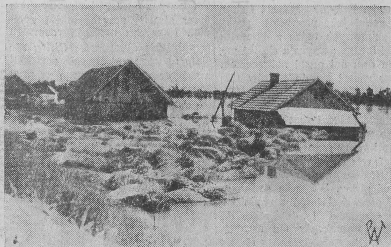
Zalane chaty, zniszczone zbiory pod Sandomierzem