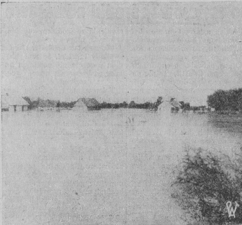
Zatopiona wieś w Krakowskiem.

Faktomontaż specjalny dla „Głosu Porannego“