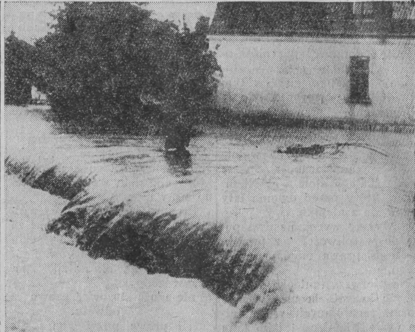
Jedna z ulic Szczucina, gdzie na skutek zalewu wytworzył się istny wodospad.

Nadprogram Aktualności Paramount i P. A. T.