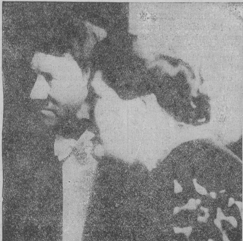
Hitler w towarzystwie pani Wagner na ostatnim festywalu w Beyreuth.