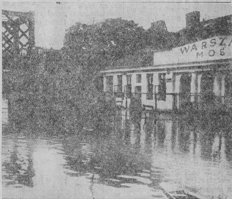
Zalany budynek stacji kolejowej Warszawa — Most.