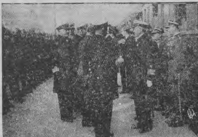
Powitanie admirała Gallera i oficerów marynarki sowieckiej przez władze marynarki polskiej na dworcu w Warszawie.

WARSZAWA, 5.9. (PAT) — Ambasador ZSRR w Warszawie wyjechał dzisiaj wieczorem do Gdyni wraz z delegacją marynarzy sowieckich z admirałem Gallerem na czele. Ambasador Dawtjan będzie towarzyszył eskadrze sowieckiej do Leningradu.