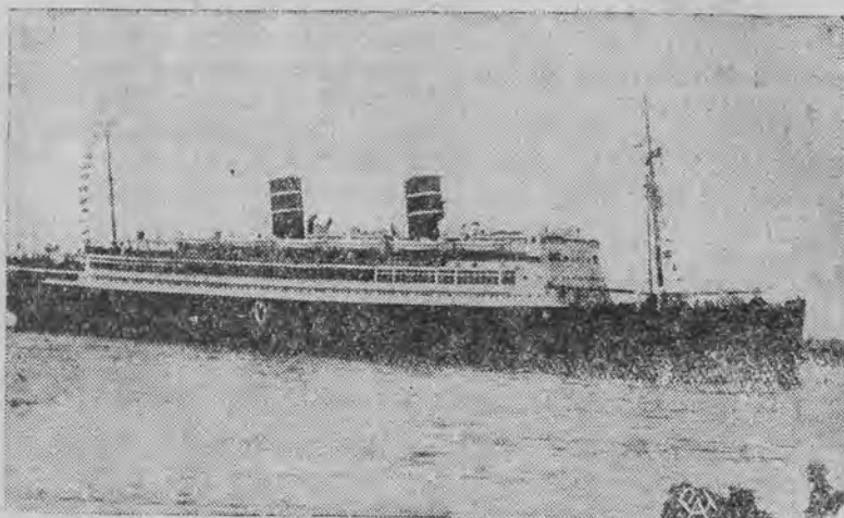
Amerykański statek pasażerski „Morrocastle”, który spłonął w odległości 8 kilometrów od brzoju New Jersey.