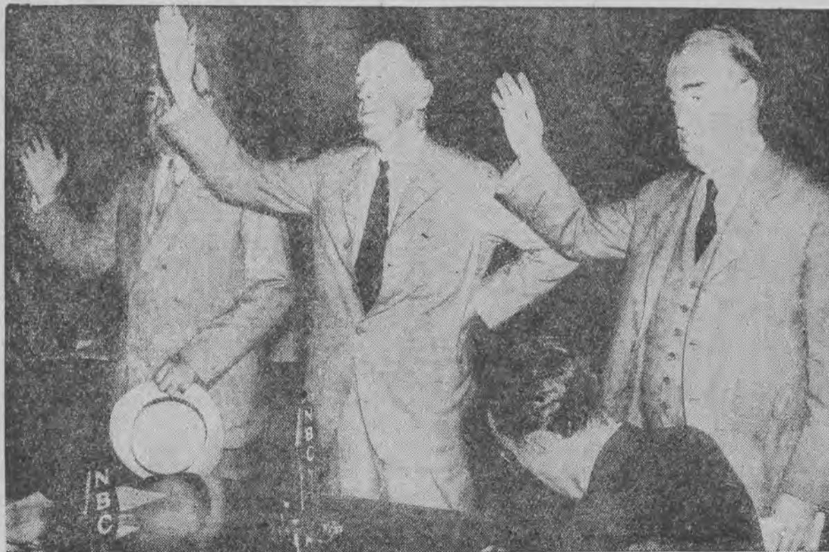
Prezydent komisji senackiej w Waszyngtonie i asystenci składają przysięgę przed rozpoczęciem rozprawy, dotyczącej skandalu z dostawami broni.