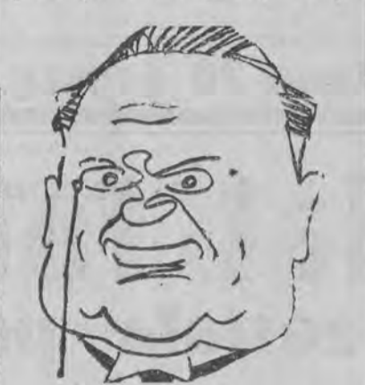
Litwinow w karykaturze

innym systemie politycznym i społecznym. Warunkiem tego musi tylko być uznanie zasady wzajemnego