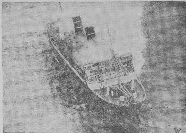
Statek został podobno podpalony przez marynarza, który zamordował kapitana i chciał ukryć swą zbrodnię.