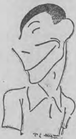
JEAN BOROTRA—AS TENNISOWY.

Borotra spędził onegdajszy dzień w Wiedniu, wczoraj był we Lwowie, a dziś przybędzie do Warszawy o godzinie 8-mej, pociągiem lwowskim. Na dwor