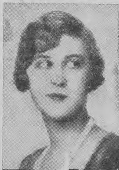
Ks. Maryna grecka, wychodzi za syna króla angielskiego

Gdy księżna Maryna grecka wraz z rodzicami przybyła do Londynu, utworzył się szpaler z wielu tysięcy głów, by najserdeczniej powitać narzeczoną najmłodszego angielskiego księcia. Przyjęto ją z zupełnie wyjątkową, jak na Anglików, żywą radością i już w kilka tygodni po ogłoszeniu zaręczyn stała się ulubienicą narodu. Nazwano ją „Princess Charming”, w czym ma się nawierać zarówno uznanie dla jej urody, jak i osobistego uroku i wdzięku, w połączeniu z prostotą obyczajów. Teraz Angliki prześcigają się w grzesnościach i objawach sympatii dla księżniczki Maryny. Na ostatniej wielkiej wystawie róż w Londynie gatunek odznaczony pierwszą nagrodą, otrzymał nazwę: „Księżna Maryna”, a dzisiaj już można kupić rakietki tenisowe księżnej Maryny, papierosy i puder. Cały Londyn płci pięknej, oczywiście, kopiuje dokładnie skromne suknie księżniczki.