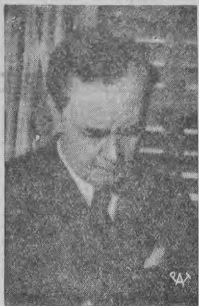
pianista polski występuje w Warszawie