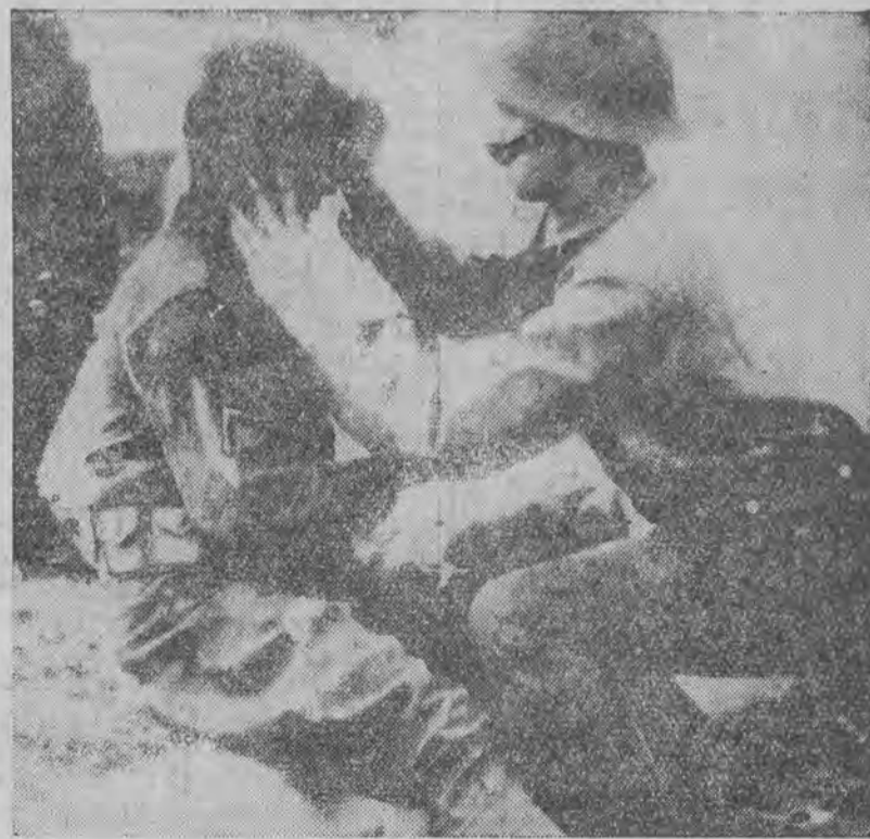
Członek gwardji narodowej opatruje swego kolegę, rannego podczas walk ulicznych.

Spokojnie śpi ten, kto swe kosztowności przechowuje w