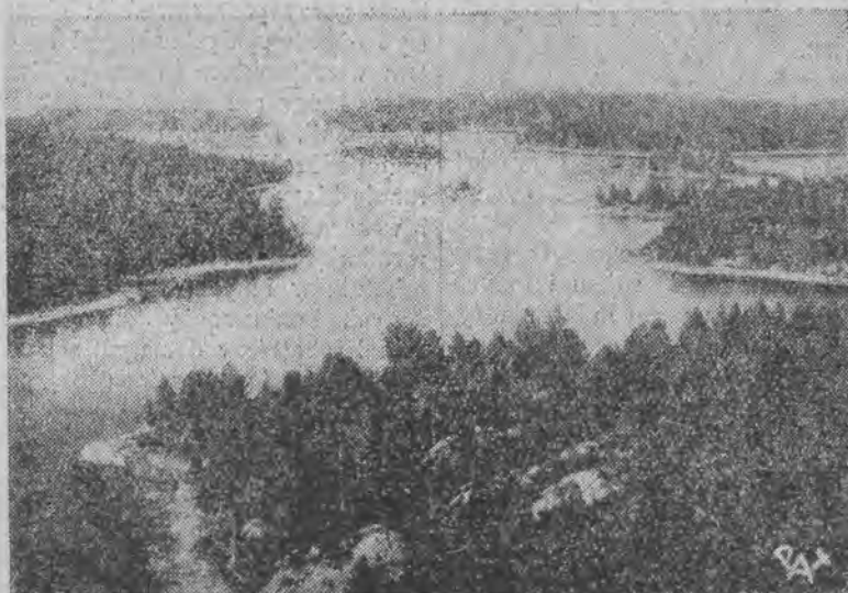
Tam, gdzie opadł balon „Polonia” — jezioro koło miejscowości So-vannina w Finlandji

łoga „Kościuszk” oświadczyła, że balon osiągnął wysokość 6 tysięcy metrów. Lotnicy polscy z uznaniem wyrażają się o gościnności i opiece, z jakimi spotkali się ze strony władz i społeczeństwa sowieckiego.