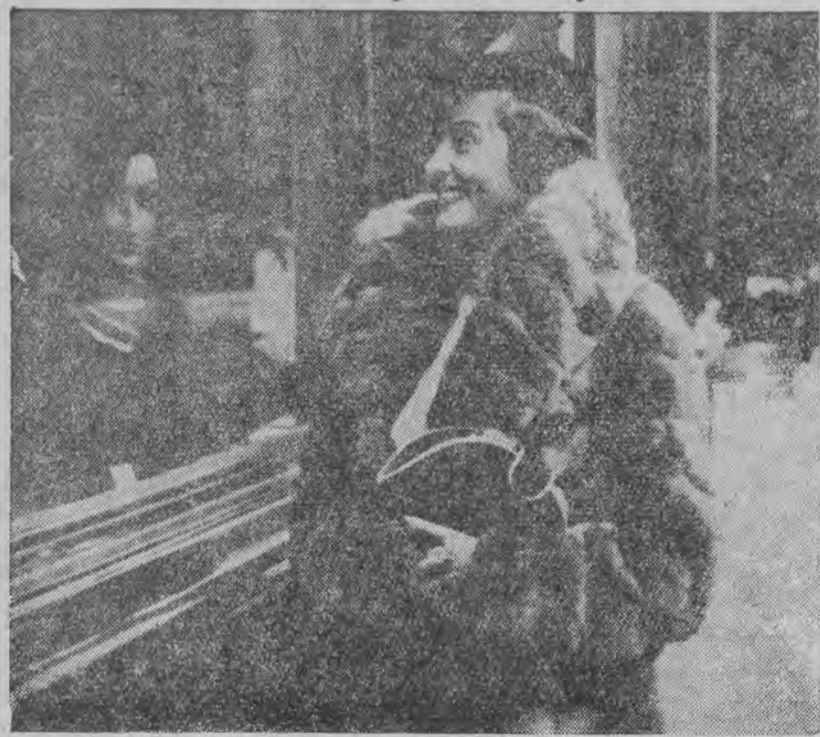
Piękność fińska, uznana za najładniejszą kobietę Europy na prze- chadzce.