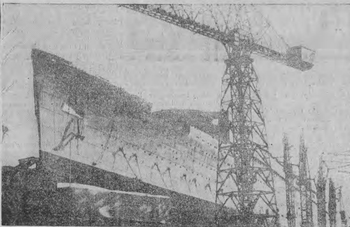
Największy statek świata, rywal znajdującej się w budowie francuskiej „Normandie” został spuszczonej na wodę. Zdjęcie nasze przedstawia ten uroczysty dla Anglików moment.