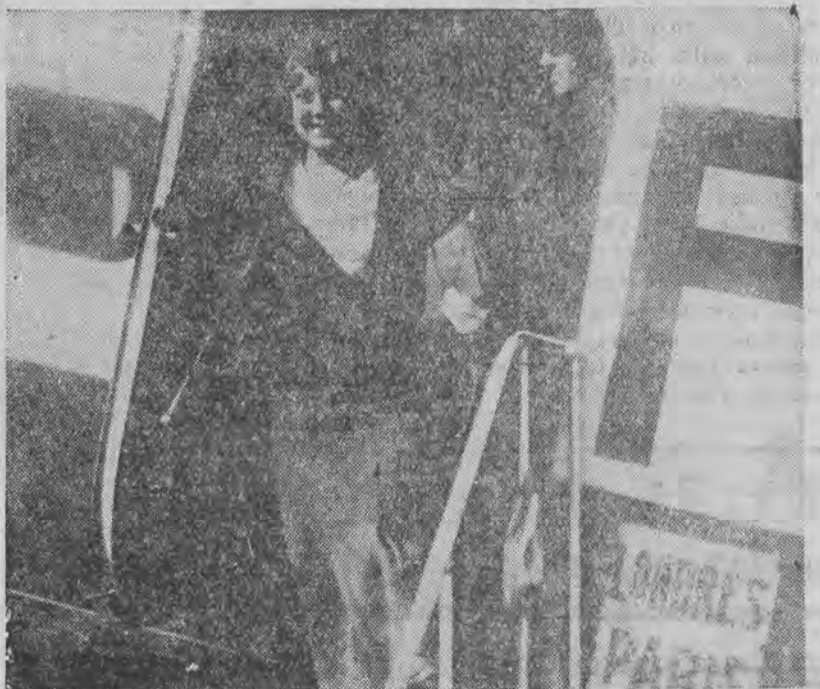
Znakomita łyżwiarka przybywa na lotnisko w Bourget pod Paryżem