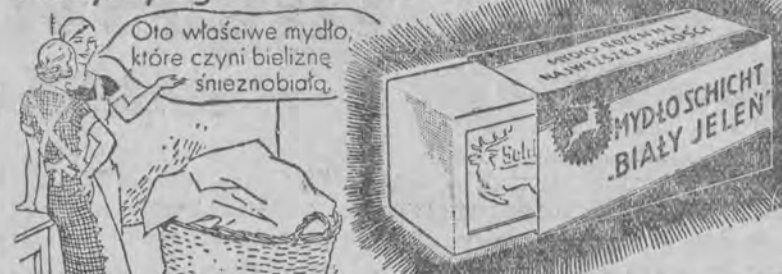
Śnieżnobiała bielizna przez śnieżnobiałe mydło