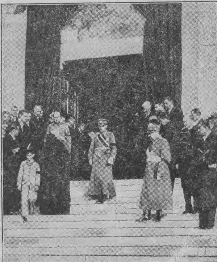
opuszcza w towarzystwie matki grobowiec swych przodków, gdzie złożono na wieczny spoczynek zwłoki jego ojca, Aleksandra I.