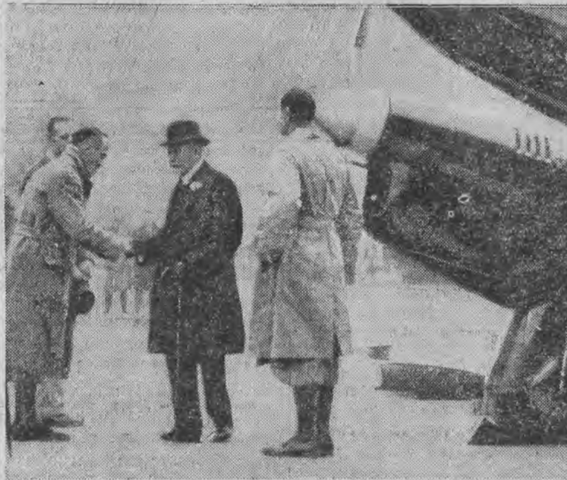
Król angielski Jerzy żegna zawodników odlatających do Australji.

dwa aparaty brytyjskie. Jeden z nich wskutek uszkodzenia motoru znajduje się na Cyprze, drugi zaś ze złamanym propelerem w Tatoi w Grecji.