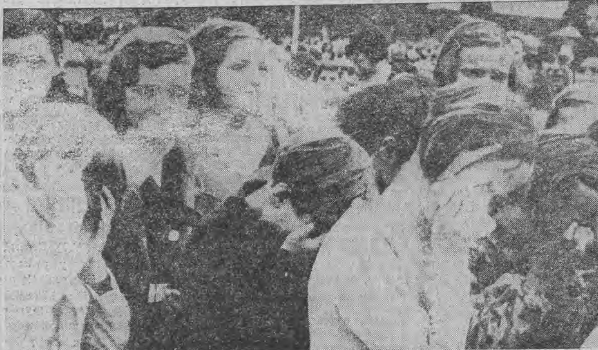
Grupa dzieci płacze, przechodząc koło trumny króla Aleksandra I