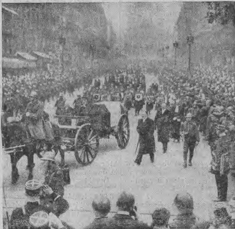
Kondukt żałobny na ulicach Paryża