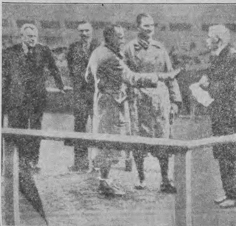
przez fundatora nagrody, Robertso na. Fotografję przekazano do Europy drogą telewizyjną.