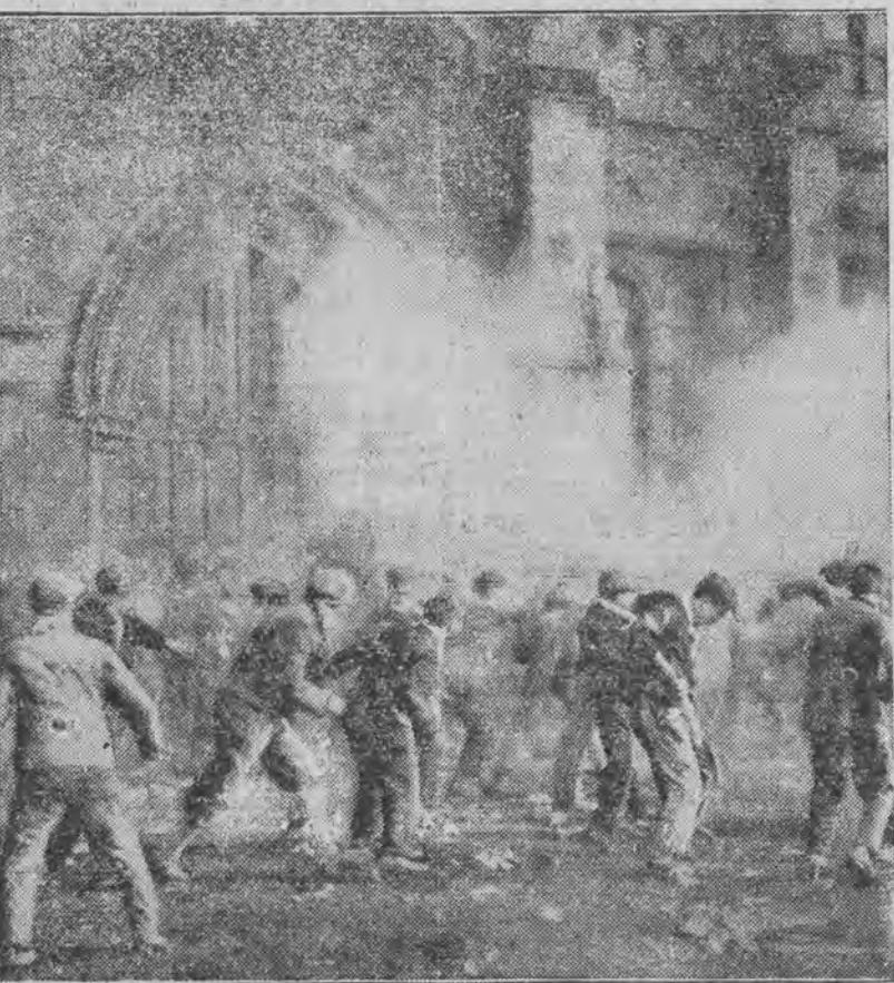
toczą tradycyjnie studenci uniwersytetu w Glasgow (Anglja) podczas corocznych wyborów rektora.