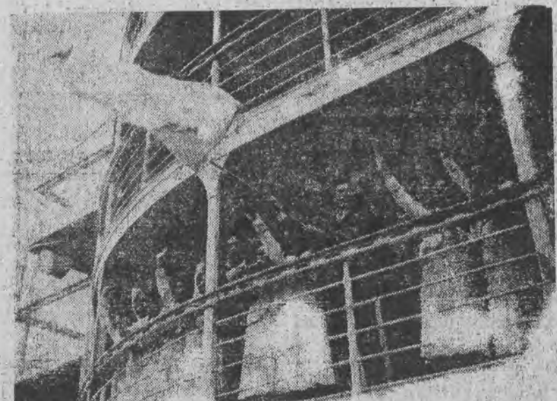
Stanisława Walasiewiczówna w otoczeniu powracających z Londynu wybitnych lekkoatletek japońskich na pokładzie statku w chwili wjazdu do portu Koba.