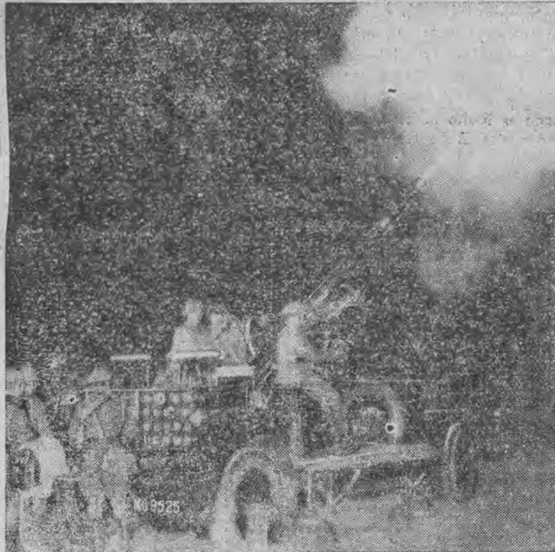
do ostrzeliwania samolotów, używana w armji brytyjskiej.