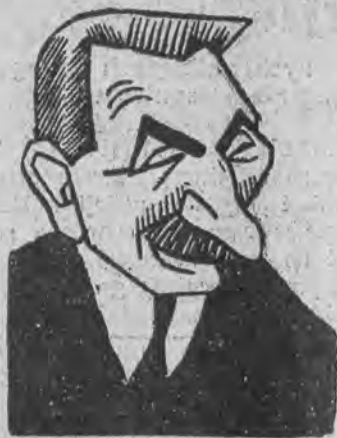
GERMAIN - MARTIN nowy minister finansów we Francji.

PARYŻ, 5. 11. (PAT). Omawiając sytuację wewnętrzną, radykalna „Œuvre” zwraca uwagę na pogłoski, kursujące w kuluarach izby na temat rozdźwięków w łonie rządu. W myśl tych pogłosek min. Germain Martin wyraził szereg zastrzeżeń w stosunku do wniosku premiera o uchwalenie projektu budżetowego i podobno miał nawet zagrozić dymisją.