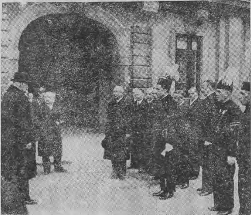
Przybyła do Warszawy na święto niepodległości delegacja górników w liczbie 220 osób, reprezentacja około 50 kopalń węgla z trzech załębi: śląskiego, dąbrowskiego i krakowskiego na dziedzińcu Zamku składa hold p. Prezydentowi