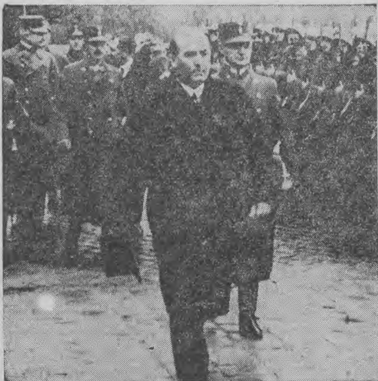
przechodzi przed frontem kompanji honorowej.