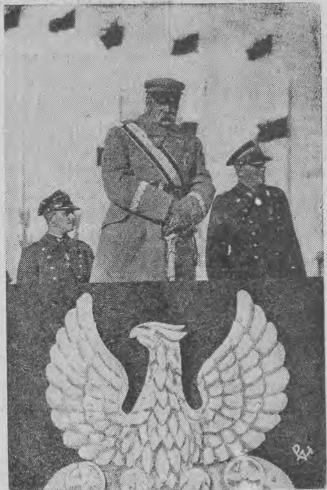
na trybunie podczas rewji - w dniu 11 listopada r. b.