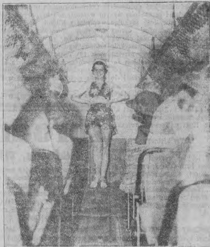
Najnowszy ekscentryczny pomysł bogatych amerykańek na Florydzie

Najpiękniejszy film produkcji sowieckiej