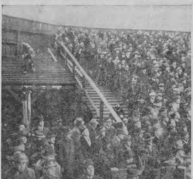
Podczas spotkania piłkarskiego w Pradze, na którym obecnych było 25 tys. widzów, zawalila się trybuna, grzebiąc 200 ludzi. Jednak meczu nie przerwano, dzięki temu uniknięto paniki.