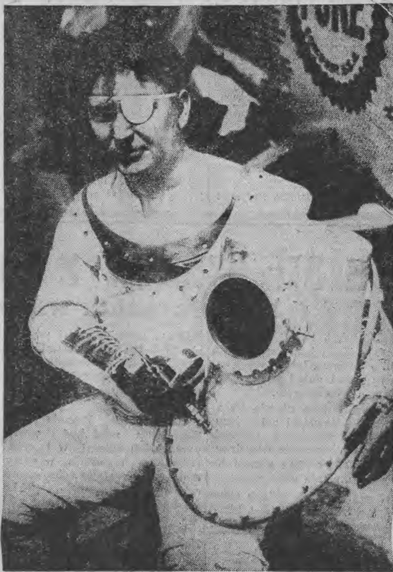
Znakomity lotnik Willy Post pobili nowy rekord wysokości, wzbijając się na wysokość 14.630 metrów. Na zdjęciu widzimy go w specjalnym ubraniu, umożliwiającem mu te stratosferyczne loty.

musowego lądowania czy wodowania w okolicach podbiegunowej pustyni, gdzie trudno spodziewać się pomocy.