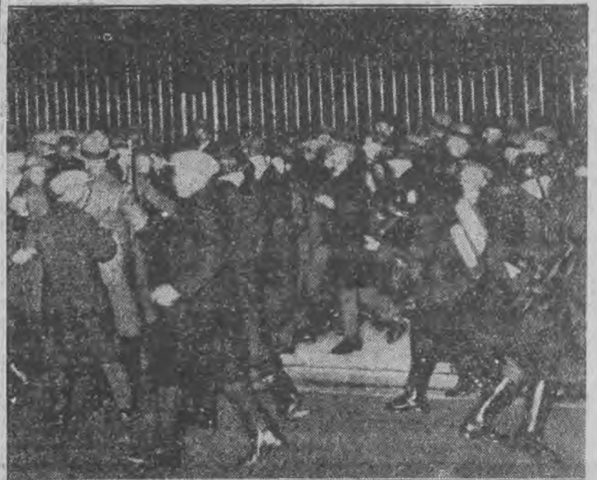
10 tysięcy chłopów demonstrowało w stolicy przeciwko niskim cenom produktów rolnych.