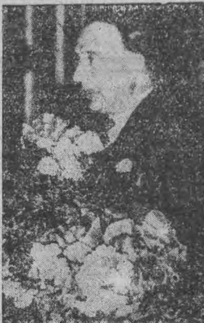
znany pisarz francuski, wygłosił ostatnio odczyt w Berlinie.