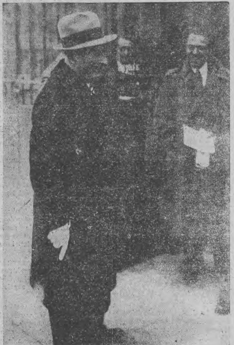
dowódca wojsk włoskich w zagłębiu Saary.