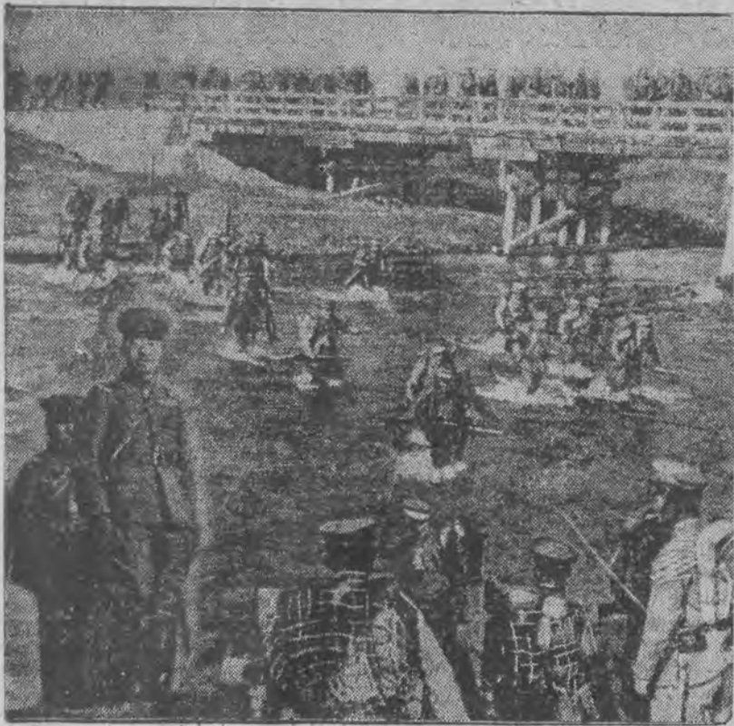
odbyły się w północnej części kraju pod osobistym kierownictwem cesarza Hirohito (z lewej strony na pierwszym planie).