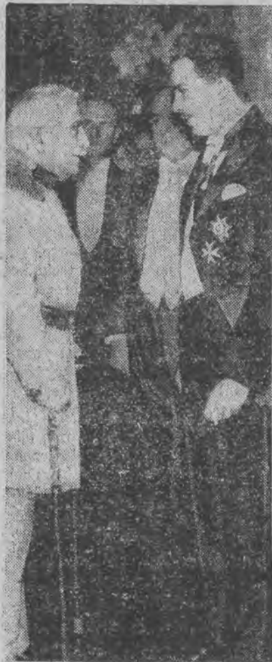
Pretendent do tronu austro-węgierskiego w rozmowie z generałem Franchet-Espery.

Przy słabym trawieniu, reguluje naturalną wodę górska „Franciszka-Juzefa” tak ważną obecnie izolelnością kiszek. Pyt. się lek.