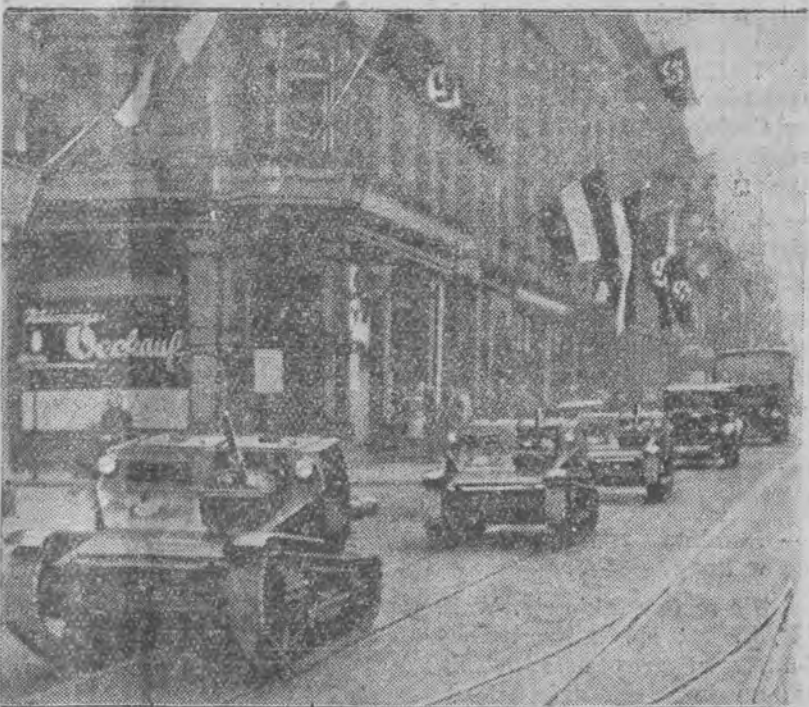
Czołgi włoskie w Saarbrücken

„Armia, państwo, partja i naród tworzą dziś nierozdzielny całość, która usiłuje zdobyć sobie pozycję w świecie. Pragniemy pokoju i dostarczyliśmy światu dość dowodów naszej woli pokoju. Uregulowaliśmy nasz stosunek z Polską i jesteśmy na drodze do porozumienia z Francją w kwestji Saary.