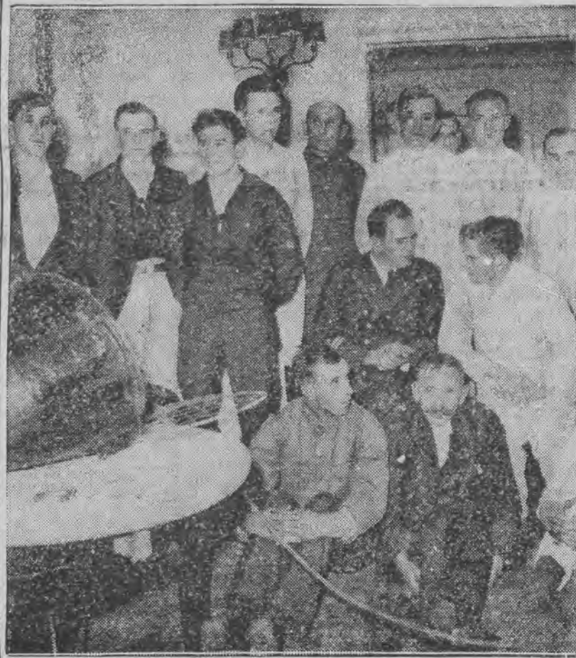
który zatonął podczas orkanu przy Azorach, została uratowana przez parowiec ratunkowy „New York“.

Po długich i ciężkich cierpieniach rozstał się z tym światem nasz najukochańszy brat, szwagier i wuj