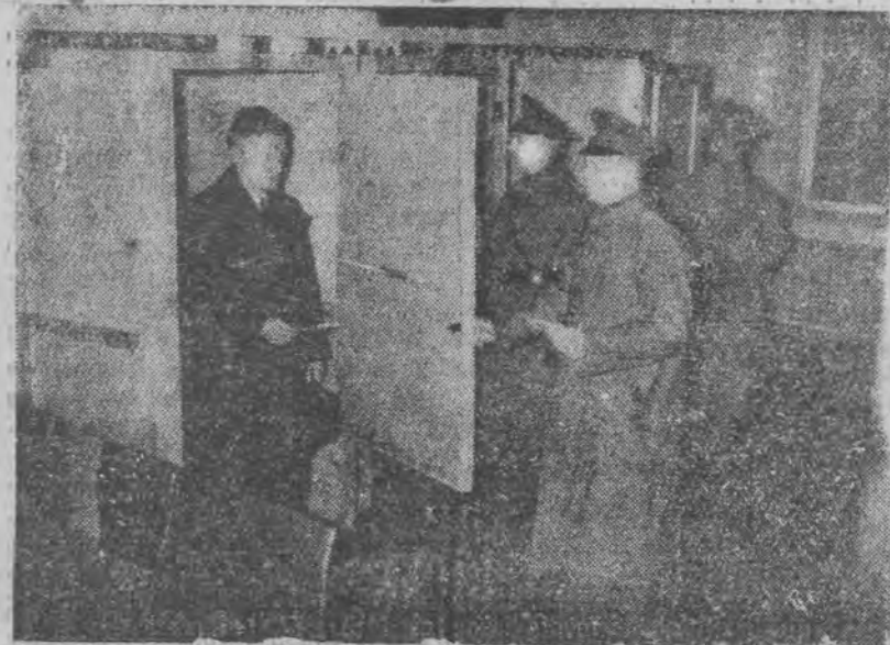
Celem zapewnienia całkowitej tajności głosowania w Zagłębiu Saary wypełnianie blankietów wyborczych odbywa się w specjalnych zamkniętych celach pod kontrolą policji.

Depesza do ligi narodów z wezwaniem o natychmiastową interwencję