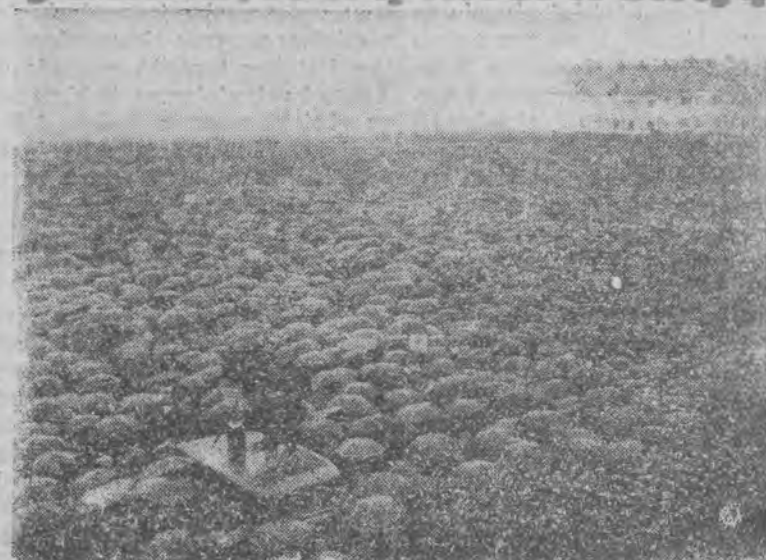
Olbrzymi wiec Frontu Niemieckiego mimo ulewnego deszczu, zgromadził tysiące mieszkańców Zagłębia Saary.

SAARBRUECKEN, 11.1. (PAT) — W ostatnich dniach przed plebiscytem mnożą się próby wprowadzenia w błąd głosujących. M. in. rozpowszechniano ulotkę, podpisaną przez przywódców stronnictwa chrześcijańsko - społecznego. Ulotka ta głosiła, że stronnictwo jest rozwiązane i że jego przywódcy,