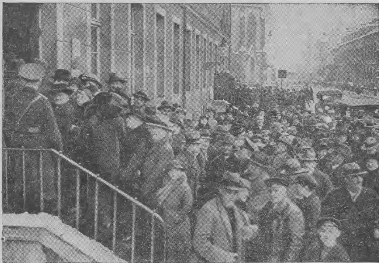
Długie ogonki w niedzielę przed ołbodem przed lokalami plebiscytowymi.