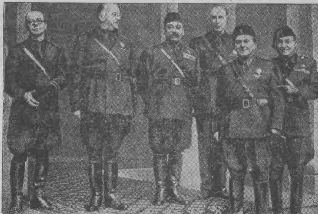
Od lewej stoją: Antonio Benni, min. komunikacji, Arrigo Solmi, min. sprawiedliwości, hrabia Cesare de Becchi min. oświecenia, hrabia Paolo Thaon de Reval, min. finansów, Edmondo Rossini, min. gospodarstwa wiejskiego i Luigi Razza, min. robót publicznych.