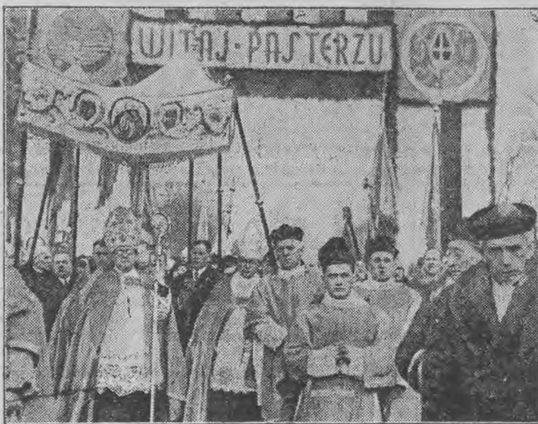
Powitanie J. E. ks. biskupa Włodzimierza Jasińskiego pod bramą tryumfalną na ul. Piotrkowskiej.