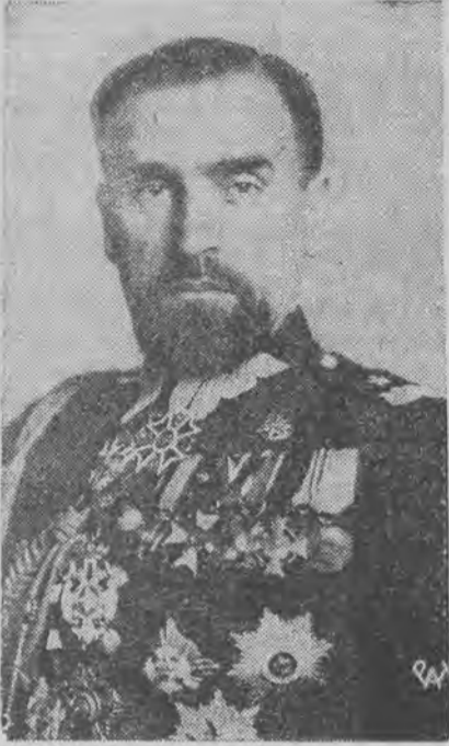
Nowy komendant główny policji państwowej.