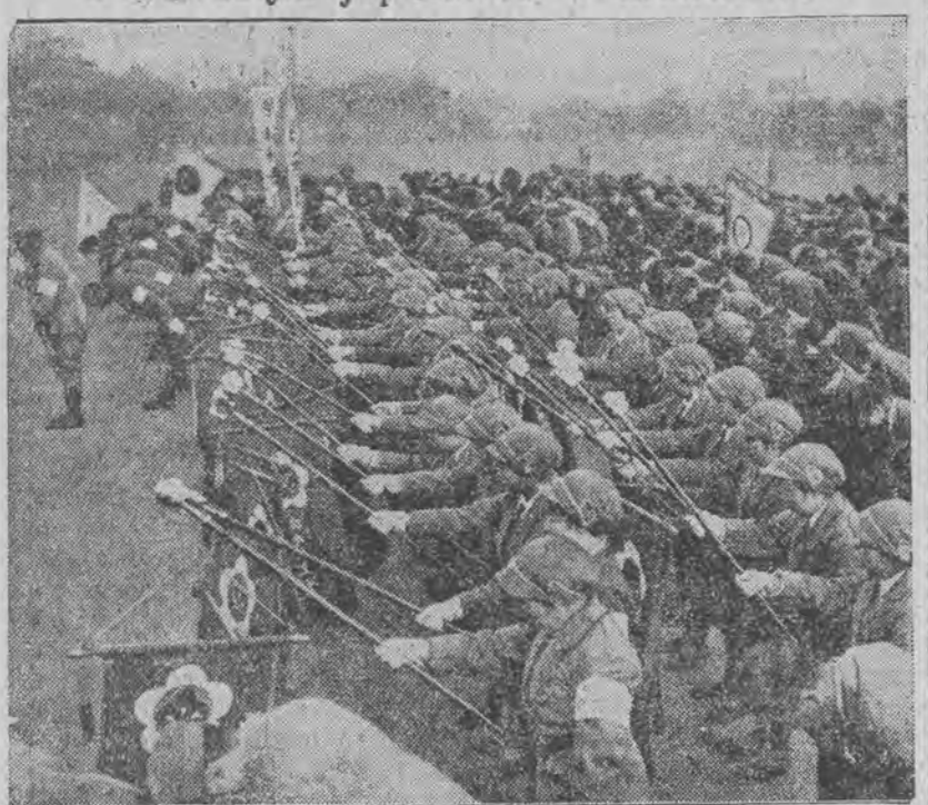
Hold dziewcząt japońskich ze sztandarami na czele przed pałacem Mikada w Tokio w dniu pierwszych urodzin małego następcy tronu