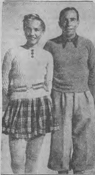
zdołali w St. Moritz mistrzostwo Europy w jeździe parami na łyżwach.