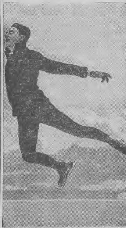
mistrz Europy w jeździe na łyżwach