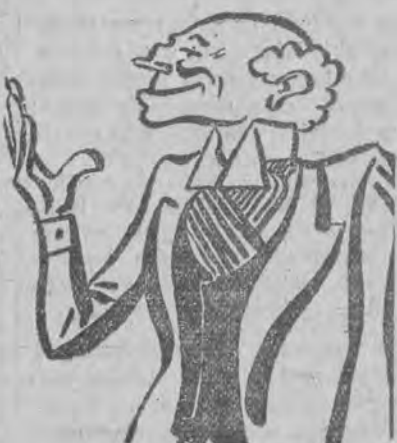
SIMON, angielski minister spraw zagranicznych.

LONDYN, 1. 3. (PAT). Min. Laval oraz min. Simon w wyniku wczorajszej rozmowy w Paryżu stwierdzili, że oba rządy w dal-