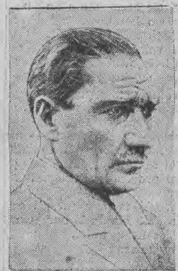
dawniejszy Kemal Pasza, został po nownie obrany jednogłośnie prezydentem republiki tureckiej.