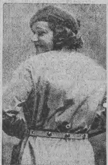
stanowi część kostiumu, demonstrowanego na londyńskim pokazie mody, a mającego podnieść bezpieczeństwo przechodniów na ruchliwych ulicach miasta.