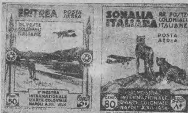
które zostały ostatnio wydane z przeznaczeniem do dwóch kolonii afrykańskich Włoch, So mali i Erytrei.