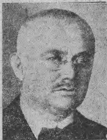
austrjacki mąż stanu, odpowiadający obecnie przed sądem we Wiedniu za zamach na rząd Dollfussa.