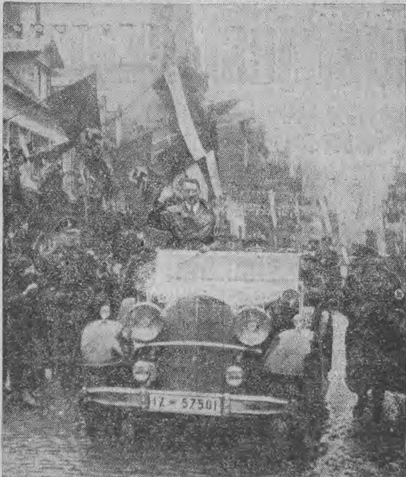
Thumy mieszkańców witają na ulicach „Führera” w dniu obejmowania władzy przez Rzeszę.