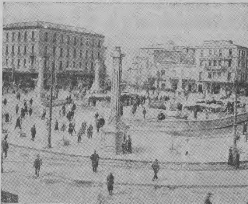
Plac Zgody w stolicy Grecji, na którym znajduje się wielki dworzec podziemny.