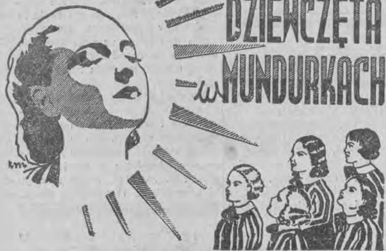
Wkrótce w kinie „PALACE”

Praga (470) 21.25 Kwartet smyczkowy A-moll Beethovena.