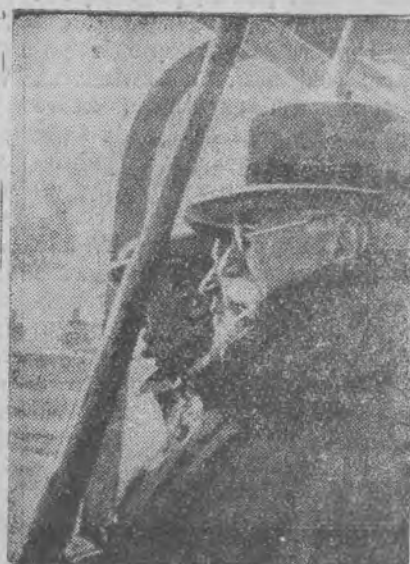
Rewja floty powstańczej

LONDYN, 11. 3. (PAT). Z Aten donoszą: Gen. Kondylis ogłosił, że trudność zdobycia Seresu polegała na tem, że w odległości 7 mil od miasta powstańcy zajęli okopy pozostawion z czasów wojny, znane jako „linja Hindenburga”.