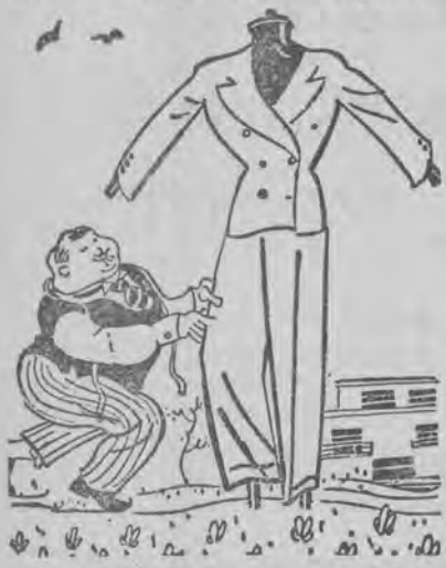
Strach na wróble, ustawiony przez wzhogaconego krawca.