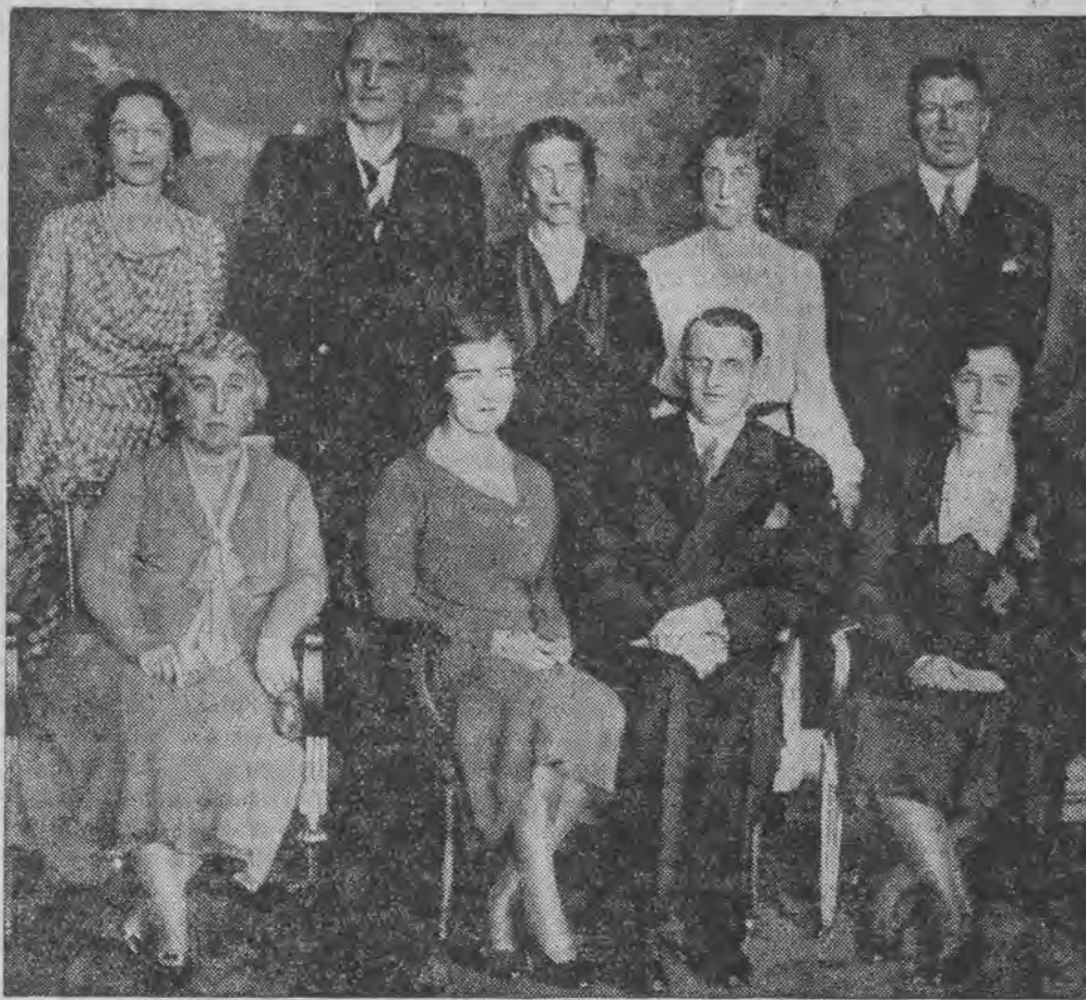
Od lewej: Księżniczka Małgorzata duńska; ks. Karol szwedzki; arcyks. Luiza szwedzka; ks. Ingeborga szwedzka; arcyks. Gustaw Adolf szwedzki. Od lewej siedzą: Ks. Helena Wiktorja, siostra króla angielskiego; ks. Ingrida; arcyks. Fryderyk; królowa duńska Aleksandra, która zresztą wieczorem po uroczystym obiedzie poważnie zaniemogła i musiała poddać się operacji, naskutek czego wszystkie dalsze uroczystości zostały odwołane.

Donosiliśmy o zaręczynach duńskiego następcy tronu księcia Fryderyka z księżniczką Ingrid Bernadotte, córką szwedzkiego następcy tronu. Młoda księżniczka znana jest ze swoich „demokratycznych” upodobań. W swoim czasie ukończyła kurs pielęgniarstwa, później kurs gospodarstwa domowego, potem bierze czynny udział w charytatywnym życiu stolicy swojego kraju. Patronuje wielu stowarzyszeniom religijnym i społecznym. Wykazuje ogromne zainteresowanie problemem socjalnym z naukowego punktu widzenia. Wogóle uchodzi za jeden z najciekawszych umysłów kobiecych swojego kraju. Nie przeszkadza to jej być dobrą sportsmen-