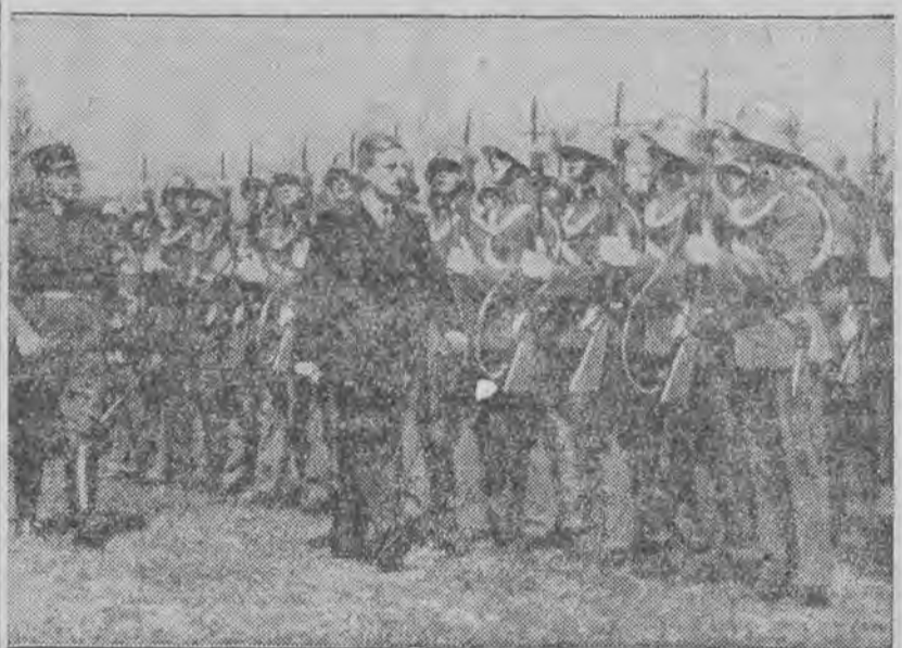
nowoutworzonego bataljonu gwardji austriackiej.

B. J. Maroko i Swię UL. NOWOMIEJSKA 8 Skład sukna i towarów modynych. Specjalny dział materiałów na PALTA DAMSKIE.