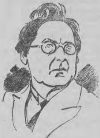
FELIKSA NOWOWIEJSKIEGO LAUREATA Państw. Nagrody Muzycznej w radjo w niedzielę 31. III. o godzinie 20.00