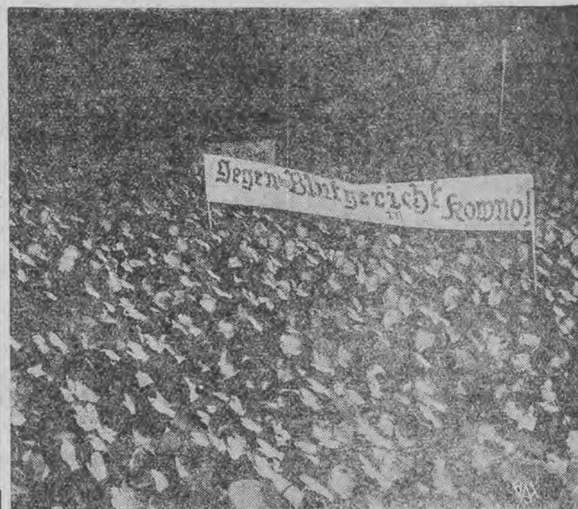
W Berlinie odbyła się olbrzymia demonstracja na znak protestu przeciwko wyrokowi sądu kowieńskiego, skazującemu na ciężkie kary kłajpedzki ch narodowych socjalistów.