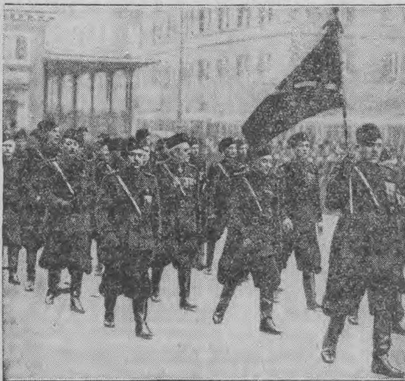
Marszerujący w pochodzie oddział starych bojowców w Medjolanie.