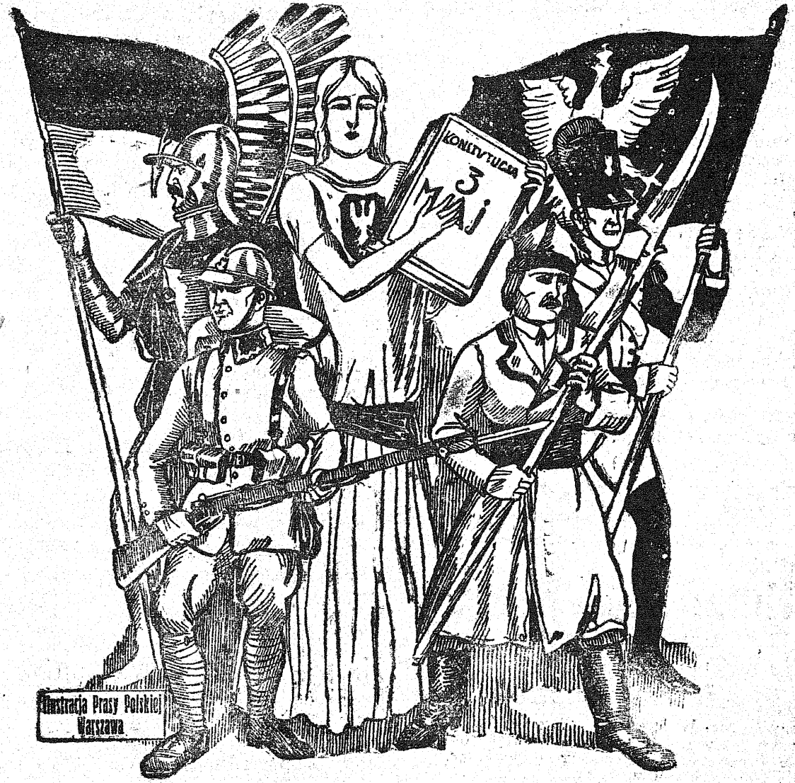
Ilustracja Prasy Polskiej Warszawa

Co roku od lat 136-ciu obchodzimy uroczyste dzień TRZECIEGO MAJA. Dzień ten, w którym z rozjonych ust naszych rodaków płynie pieśń i modlitwa „Ojczyzno, Wolność zachowaj nam Panie” przypomina nam ów dzień 3-go Maja 1791 roku, kiedy naród polski w chwili upadku, gnieciony przez Rosję, Austrię i Prusy, uchwałił w Sejmie wielkopomną ustawę rządową, określającą nowe prawa i obowiązki obywateli polskiego. „KONSTYTUCJĘ TRZECIEGO MAJA” Dlatego też tak wielką narodową otaczamy ów wielki dzień Konstytucji