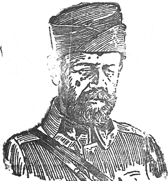
Lucjan Żeligowski, generał dywizji, Minister Wojny w rządzie A. Skrzyńskiego odpowiedniemi przesunięciami oddziałów wojskowych w garnizonach umożliwił marsz Piłsudskiemu dokonanie zamachu stanu.