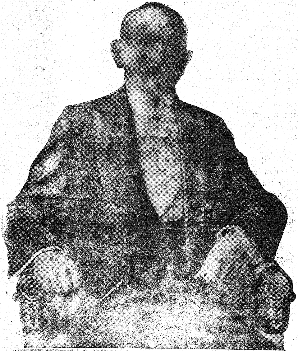
Stanisław Wojciechowski II Prezydent Rzeczypospolitej Polskiej Pod grudem kul, i naciskiem bagnetów złożył godność Prezydenta.