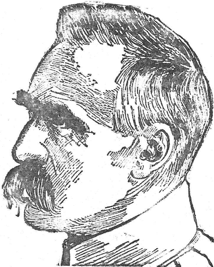
Józef Piłsudski pierwszy Marszałek w stanie nieczynnym na czele zjednoczonych oddziałów Wojsk Rzeczypospolitej. Po zaciętej walce z wojskami wiernymi Rządowi wkroczył do Warszawy.