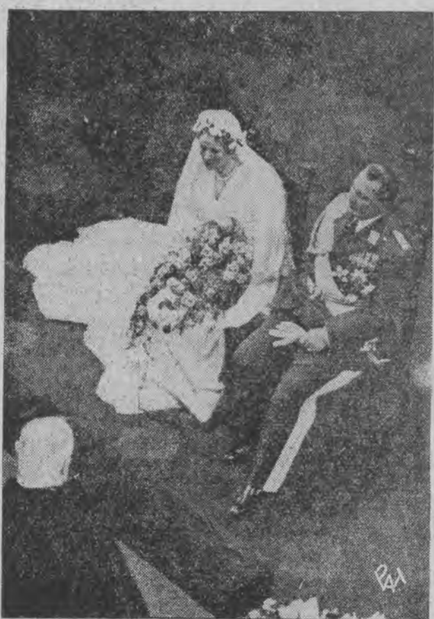
Premier pruski z narzeczoną podczas uroczystości kościelnej.