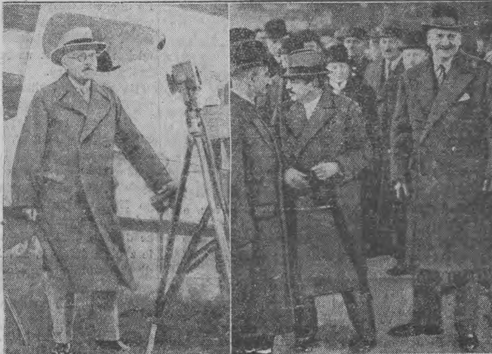
NA LEWO: MAC DONALD przemawia do mikrofonu przed odlotem z Londynu. NA PRAWO: FLANDIN (na prawo) i LAVAL na dworcu w Paryżu przed odjazdem do Stresy.

STRESA, 12. 4. (PAT). W godzinach wieczornych ogłoszono tu następujący komunikat: „Delegaci Anglii, Francji i Włoch zebrałi się dziś o godz. 9.30 pod przewod-