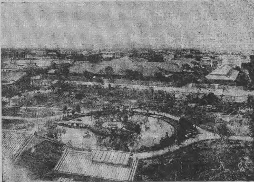
Wyspa Formoza nawiedzona została straszliwym trzęsieniem ziemi. Było tysiące zabitych i rannych. Na zdjęciu mamy typowy widok wyspy.