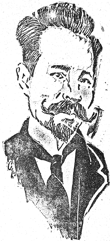
Prezydent republiki litewskiej.